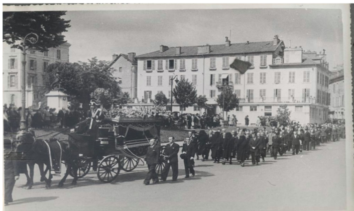
Obsèques : une foule considérable