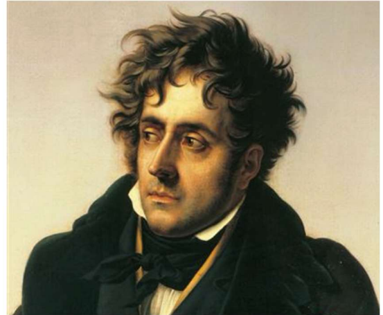
Portrait de Chateaubriand

Il y a donc un sujet parmi tant d'autres que j'hésite à aborder : Rome où je suis à peu près 4 mois par an. Mais qui peut parler de Rome ? et de quelle Rome ? Aujourd'hui, j'ai décidé de prendre le sujet par le petit bout de la lorgnette. Premiers instantanés, premières impressions liées au souvenir de ma petite-fille qui aujourd'hui prépare le Bac, toujours au Lycée Chateaubriand, lycée français de Rome.