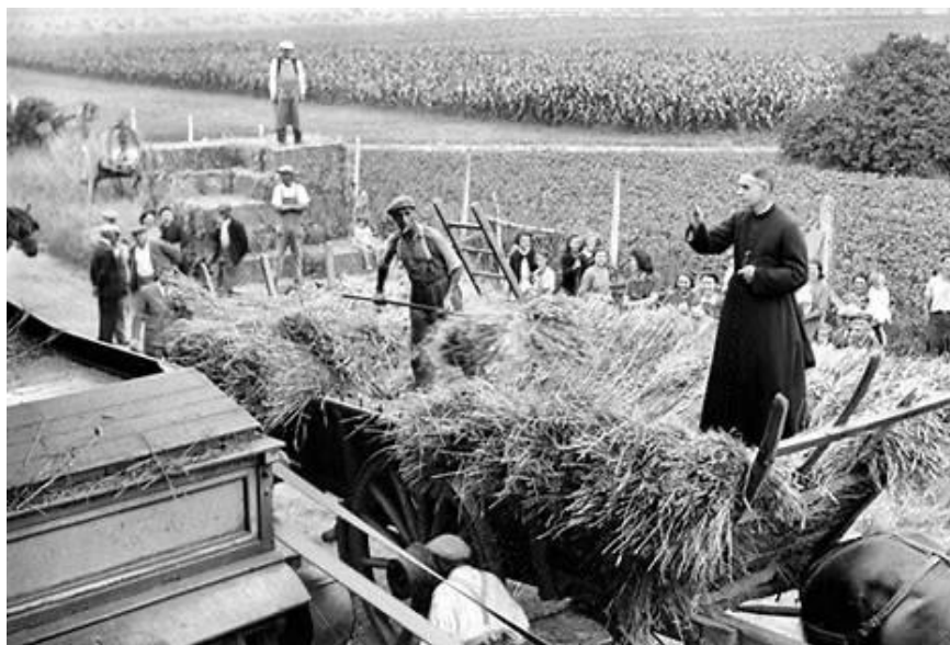
Prêtre bénissant la moisson au début du XX e siècle dans la campagne béarnaise